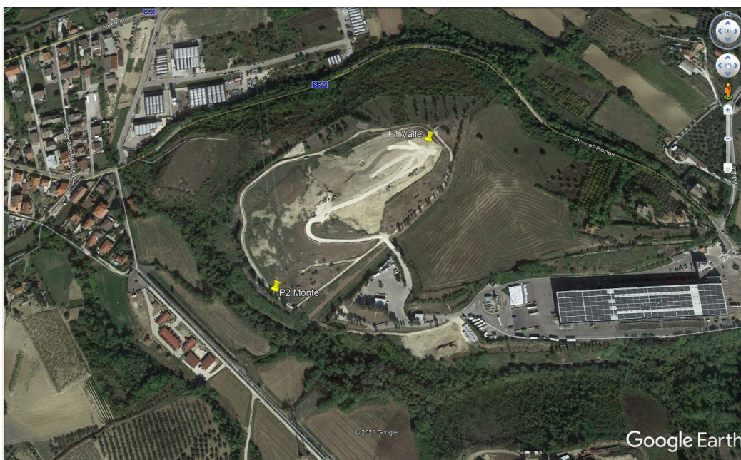
Figura 2 – Vista aerea della discarica

Coordinate satellitari: N 42°19'40,35'' – E 14°07'18,10''